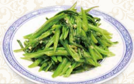
季節の青菜 にんにく強火炒め 蒜蓉炒青菜 600