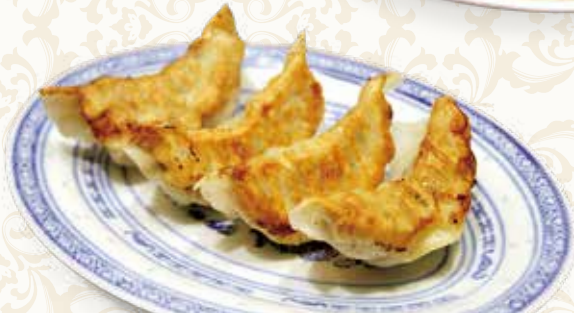
自家製焼き餃子 4個 锅贴饺子 600