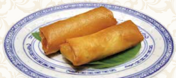
豚肉春卷 2本 肉丝春卷 500