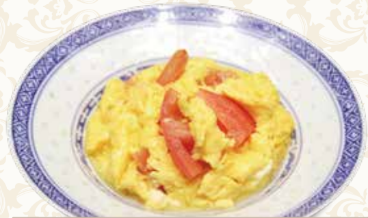
トマトと玉子のふわふわ炒め 西红柿炒蛋 600