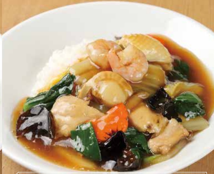
五目あんかけご飯 什錦烩飯 1,200