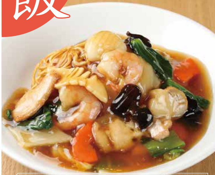
五目あんかけ焼きそば 什錦炒面 1,200