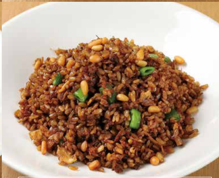
黒チャーハン 中国たまり醤油仕立て 肉末醤油炒飯 1,000