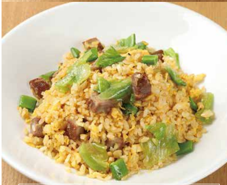
柔らかチャーシューとレタスの炒飯 醬肉生菜炒飯 1,000