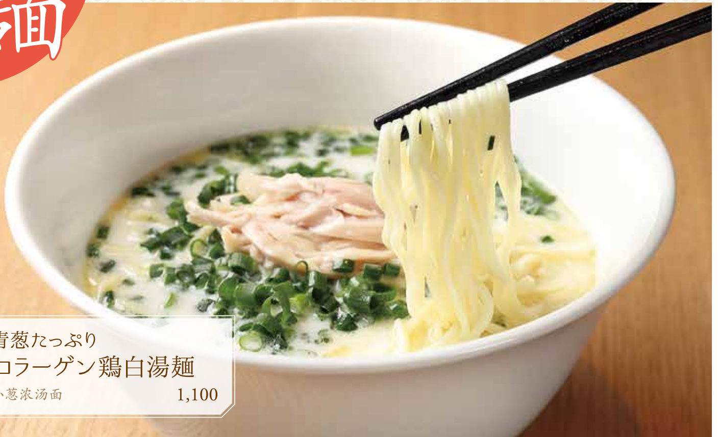
青葱たっぷり コラーゲン鶏白湯麺 小葱濃湯面 1,100